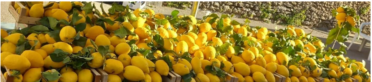
Cedri durante la festa del Cedro

La festa del Cedro, una volta detta Mezzandì, e la festa di San Meo (San Bartolomeo) sono le due feste più antiche e sentite di Bibbona. Entrambe prendono forma negli anni che precedono la stesura degli statuti comunali avvenuta nel 1490 e sopravvivono ai secoli arrivando ai giorni nostri. Non ci sono molti documenti che ci raccontano di come la festa del Cedro abbia attraversato questi 5 secoli; al contrario documenti del 1700 raccontano di una festa di San Meo che era, in quegli anni, l'evento principale di Bibbona. Addirittura l'attuale Fiera della Zootecnia, che tutt'oggi si tiene nel fine settimana del 24 agosto ricorrenza di San Bartolomeo, può essere considerata ciò che oggi rimane della medioevale festa di San Meo.